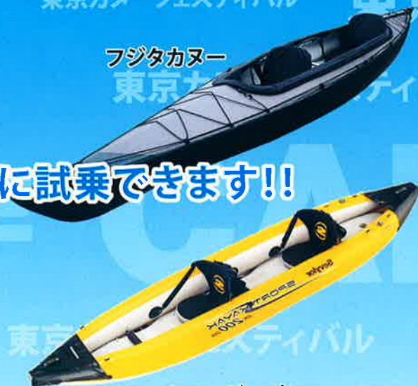
コールマンジャパン