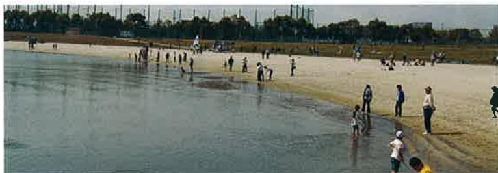
大森ふるさとの浜辺公園